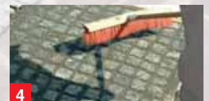
4 смести остатки