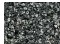
PFF – базальт

В ходе печати допускаются отклонения оттенков на изображениях.