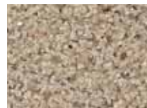
PFF – песочный