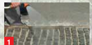
1 тщательно увлажнить